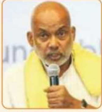
प्रो. संजय पासवान

सदस्य, विधानपरिषद्, बिहार पूर्व केन्द्रीय मानव संसाधन विकास राज्यमंत्री भारत सरकार एवं आचार्य, पटना विश्वविद्यालय, पटना (बिहार)